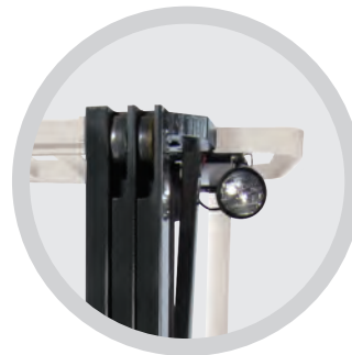
• Luces de trabajo frontal