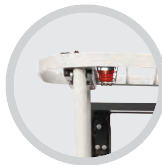
• Luz trasera